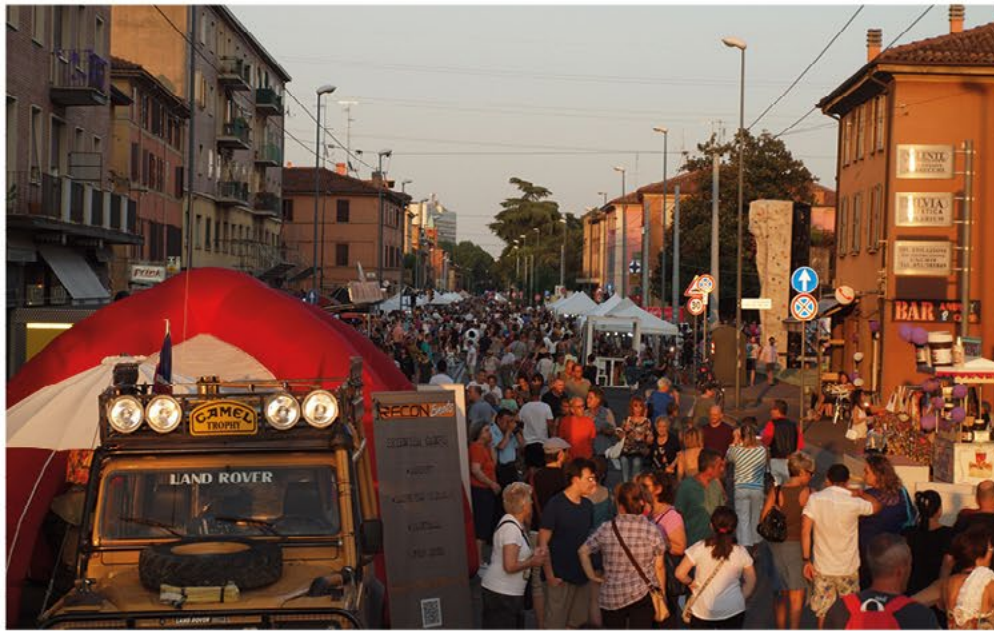
Festa di strada, Notte Viola