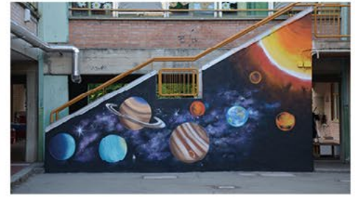
Scuola Pedrielli, sistema solare